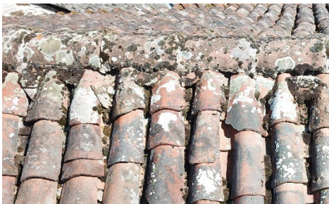
Détail toit de l'église

En 2020, un « léger » grain de sable est venu s'installer mais l'exposition de peinture initialement prévue en mai a tout de même pu avoir lieu en août avec un certain succès en terme de fréquentation, tout comme les Journées du Patrimoine où 60 personnes sont venues visiter notre église et apparemment en sont reparties satisfaites, même les étrangers qui ont bénéficié d'une présentation en anglais. Je voudrais ouvrir là une parenthèse : les billangeauds ne se rendent pas compte du trésor qu'ils ont sous les yeux tous les jours et c'est pourquoi je